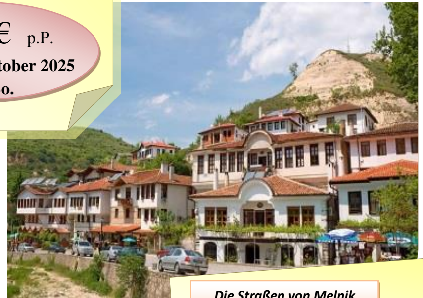
Die Straßen von Melnik