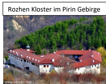
Rozhen Kloster im Pirin Gebirge